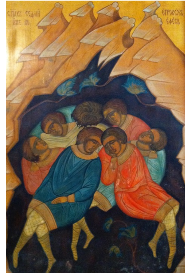
Icone des Sept Dormants de la chapelle des Sept Saints.