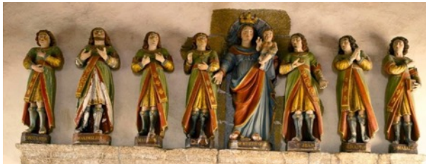
Les sept statues des Dormants d'Éphèse de la chapelle.