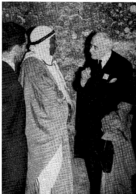
Les SEPT SAINTS AU VIEUX-MARCHÉ (Côtes-du-Nord)

UNE VÉNÉRATION COMMUNE AUX MUSULMANS ET AUX CHRÉTIENS