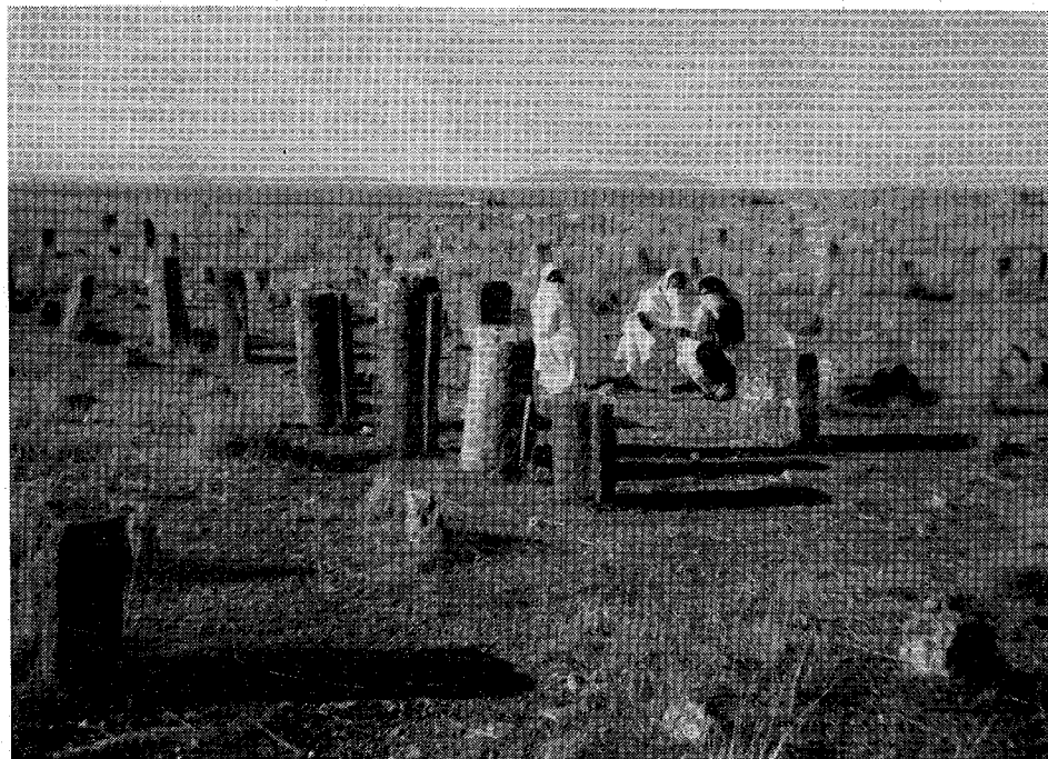
A GUIDJEL-IKJAN : les sept piliers fâtimites des SEPT DORMANTS.

2. Cf. Louis Massignon, La maison de la Vierge et la résurrection des Sept Dormants à Ephèse , ap. La France Catholique, 12 août 1955. Pour la documentation d'ensemble, voir du même auteur : Les Sept Dormants d'Ephèse en Islam et en Chrétienté , ap. Revue des Etudes Islamiques, 8 fascicules parus de 1955 à 1963.