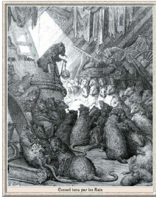
Conseil tenu par les rats