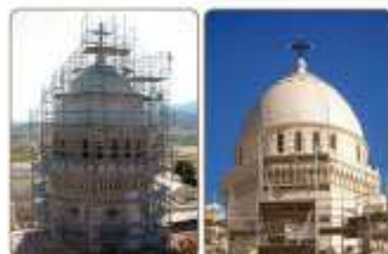
Remplacement du grand dôme

En plus des couvertures de la basilique, deux autres « chantiers » ont également été engagés, celui des façades et celui de l'intérieur de l'édifice.