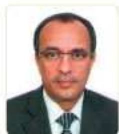
Abdallah Nabil BENSAÏD, Président de l'Assemblée Populaire Communale de Annaba