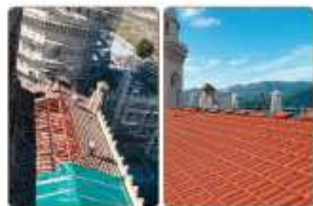
Remplacement de la toiture de la nef centrale

Après la grande tour-lanterne, achevée en fin d'année 2011, le prochain objectif des travaux est la mise hors d'eau de toutes les couvertures de l'édifice.